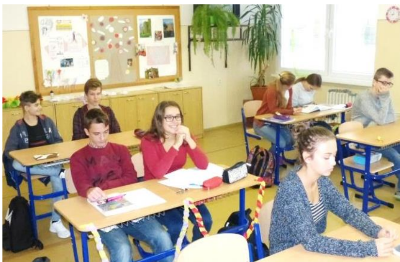
Pohľad do triedy